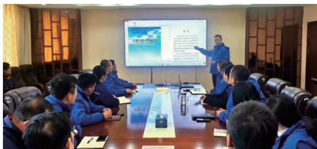
日前,利海化工公司通过公司领导班子集体学习、各党支部班子、党风党纪监督员和纪检人员集中学习、班子成员与分管部门座谈交流学习、个人自学等多种举措,深入学习集团公司《党员干部违纪违法案例警示教育读本》,进一步增强廉洁自律意识,提高拒腐防变能力,为企业高质量发展保驾护航。(梁娴)

推动纪律教育。组织全体班子成员及关键岗位人员学习《“靠企吃企”典型案例警示教育手册》,并签订承诺书。学习集团纪委编印的警示教育读本,通过用活用好身边“活教材”,警示教育“身边人”。(瞿方)