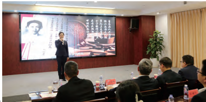
3月20日下午,海州片区区域党建共建单位供电、金桥房地产、格斯达、供销和金航资产公司联合举办“信仰之声”——传诵红色经典·赓续爱国情怀诗歌朗诵比赛,来自各单位选派的12名选手参加了比赛。(金航宣)