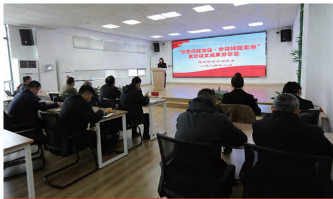
为高质高效落实“解放思想、实干担当学习实践月”活动,3月14日上午,徐圩投资公司举办“学思想强党性 学榜样强素质”主题征文成果分享会,不断提升党员干部读、写、做综合能力,真正做到学而信、学而懂、学而用、学而行。(陈蓓蓓)