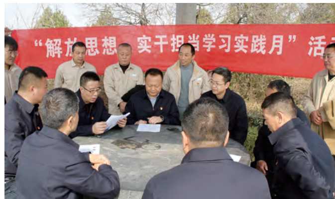
近日,为传承革命精神、发扬党的优良作风,提振党员干部干事创业的精气神。供电工程分公司台北供电所、工程运维中心党支部联合开展主题党日活动。全体党员赴赣榆抗日山烈士陵园和刘少奇故居接受红色文化教育,并开展了“解放思想、实干担当”主题大讨论活动。(张伟 刘福勇)