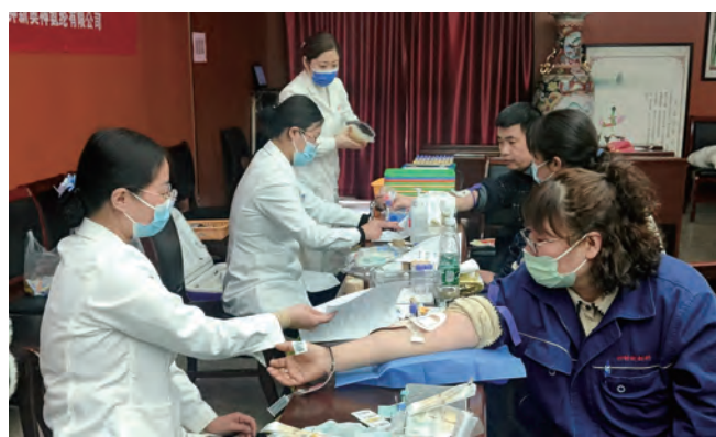
连日来,神特新材料公司、青口投资公司、氨纶公司等单位纷纷组织广大职工开展无偿献血活动,志愿者们用热血连接成爱心纽带,彰显着无私奉献精神。(神特宣 仲伟彬 韩奇)

人其实不是在闲的时候才需要静心,越是忙碌的时候越需要静心。只要能保持着一颗平和的心态,懂得放下,知道取舍,人生便没有过不去的火焰山。