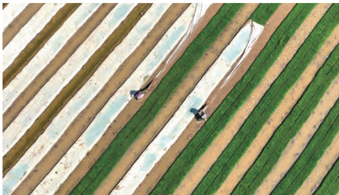
近日,青口投资公司大新农场自营农田机插秧苗已全部揭开“面纱”,秧苗整体长势较好,一片绿意盎然。目前播种较早的秧苗苗龄在三叶一心。(闫亮 刘杨)